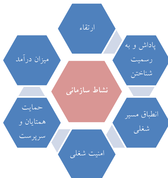
شکل ۲. مدل مفهومی نشاط سازمانی

جونستون و همکاران (۲۰۱۳) در پژوهشی به بررسی تاثیر توانایی انطباق مسیر شغلی به عنوان نقش میانجی بر رابطه بین استرس و نشاط کارکنان پرداختند که نتایج پژوهش نشان داد شفافیت مسیر شغلی باعث کاهش استرس و افزایش نشاط کارکنان در سازمان می‌شود.