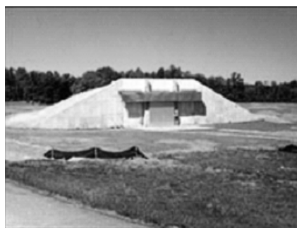
شکل ۱: نمونه‌ای از انبارهای ایگلو

این انبارها برای نگهداری طولانی‌مدت انواع مواد منفجره به کار رفته و شامل انواع انبارهای با خاک پوشیده شده، انبارهای روزمینی، انبارهای تونلی و انبارهای صحرایی هستند. الف) انبارهای با خاک پوشیده شده: این انبارها روی زمین قرارگرفته ولی سقف و دیوارهای جانبی آن‌ها با خاک پوشیده شده است. این انبارها شامل انواع انبارهای ایگلو و انبارهای مکعبی بوده که برای انبارش انواع مواد منفجره مناسب هستند. انبارهای ایگلو (شکل ۱) را ببینید، انبارهای قوسی شکلی هستند که دیوارها و کف آن‌ها از بتون مسلح ساخته‌شده و تمایزی بین دیوارها و سقف دیده نمی‌شود. سقف این نوع انبارها با خاک پوشیده می‌شود. این انبارها براساس میزان تحمل فشار پایه شامل انواع سه بار، پنج بار و هفت بار و براساس ظرفیت، شامل انواع ۱۵۰ تن، ۲۵۰ تن، ۳۶۰ تن و ۴۵۰ تن هستند. انبارهای قوسی، قوسی خمیده، قوسی-نیم‌دایره‌ای، استرادل ۴ ، فری‌لاک-استرادل ۵ ، فری‌لاک-استرادل ۶ اصلاح‌شده و انبارهای کوربتا از انواع انبارهای ایگلو هستند. انبارهای مکعبی از بتون مسلح ساخته‌شده ولی سقف آن‌ها قوسی نیست. انبارهای کانتینری (کانکسی) که روی زمین یا بین تپه‌ماهورها قرارگرفته‌اند و روی آن‌ها با گونی خاک پوشانده می‌شود، از انواع انبارهای مکعبی هستند.