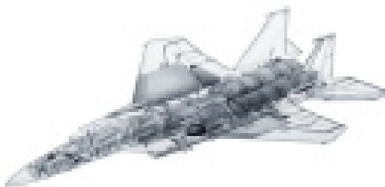
شکل ۴. تنوع واشرها

در سطح هریک از واحدهای دفاعی و چه در سطح ملی، برای نیل به اهداف مذکور، سیستم کدگذاری باید مشخصات ذیل را دارا باشد: • در مورد همه کالاهای تدارک شده ۱ اطلاعات درستی را برای همه نیروهای استفاده کننده از این سیستم در زمان