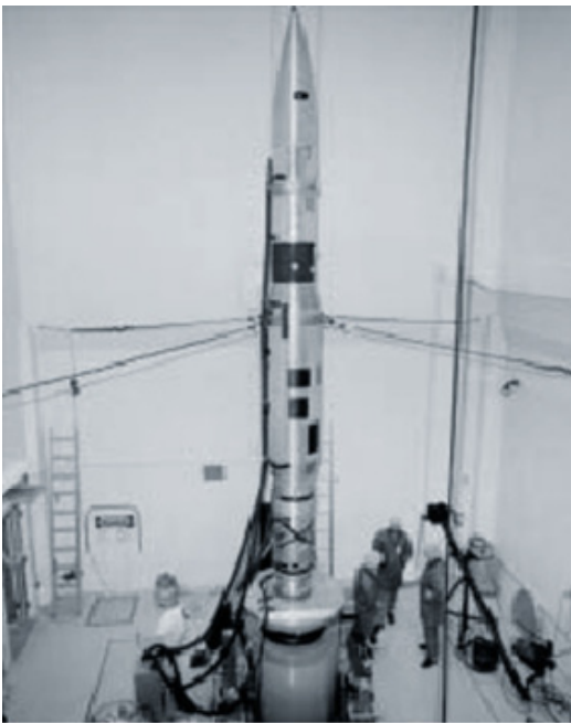
شکل ۲- نمونه ای از آزمون شرایط محیطی ارتعاش مربوط به یک موشک هدایت شونده در حالت عمودی

این آزمون تحت عنوان آزمون تایید طراحی نیز معرفی شده است و آزمونی است که تحت شرایط معین، به منظور تعیین مطابقت محصول با الزامات طراحی اجرا می‌شود؛ به طوری که مبنایی برای تصویب محصول باشد. [۳] منظور از انجام آزمون تایید صلاحیت، اثبات و بررسی دقیق این موضوع است که آیا پیاده‌سازی طراحی و روش‌های مورد استفاده جهت ساخت منجر به ایجاد سخت‌افزار و نرم‌افزاری مطابق با الزامات طراحی شده است. هدف از انجام این آزمون اثبات این موضوع است که تجهیزات در شرایط محیطی مورد نظر به صورت رضایت بخش عمل می‌کنند. [۲]